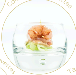
Cocktail de crevettes