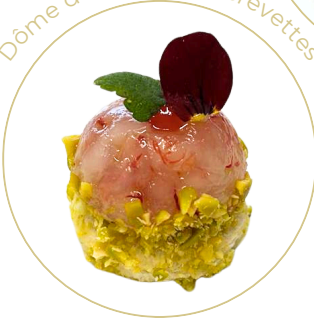
Dôme de tartare de crevettes