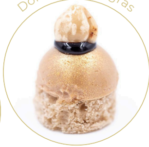
Dôme de Foie gras