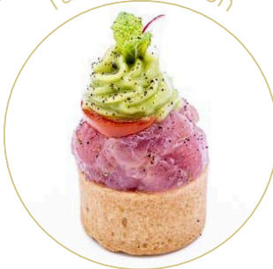
Tartare de thon