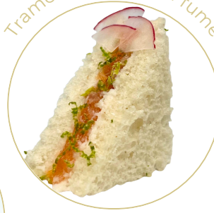
Tramezzini Saumon fumé