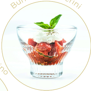
Burrata & datterini