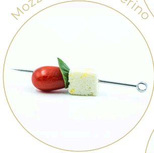
Mozzarella & datterino