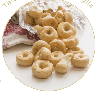
Tarallini artigianaux Puglia